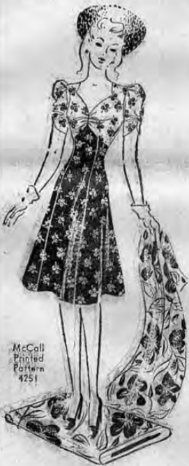
McCall Printed Pattern 4251

y experimente la satisfacción de cortar sus vestidos sin temor alguno y de estar segura de la elegancia de su figura.